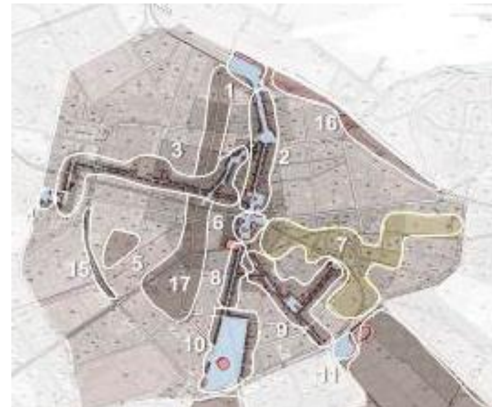
Фиг. 4. Публични пространства, определящи идентичността на град София.

Обобщени данни от проведено анкетно проучване сред 400 жители на Столичния град през август 2012 г. в рамките на разработването на ИПГВР на град София.