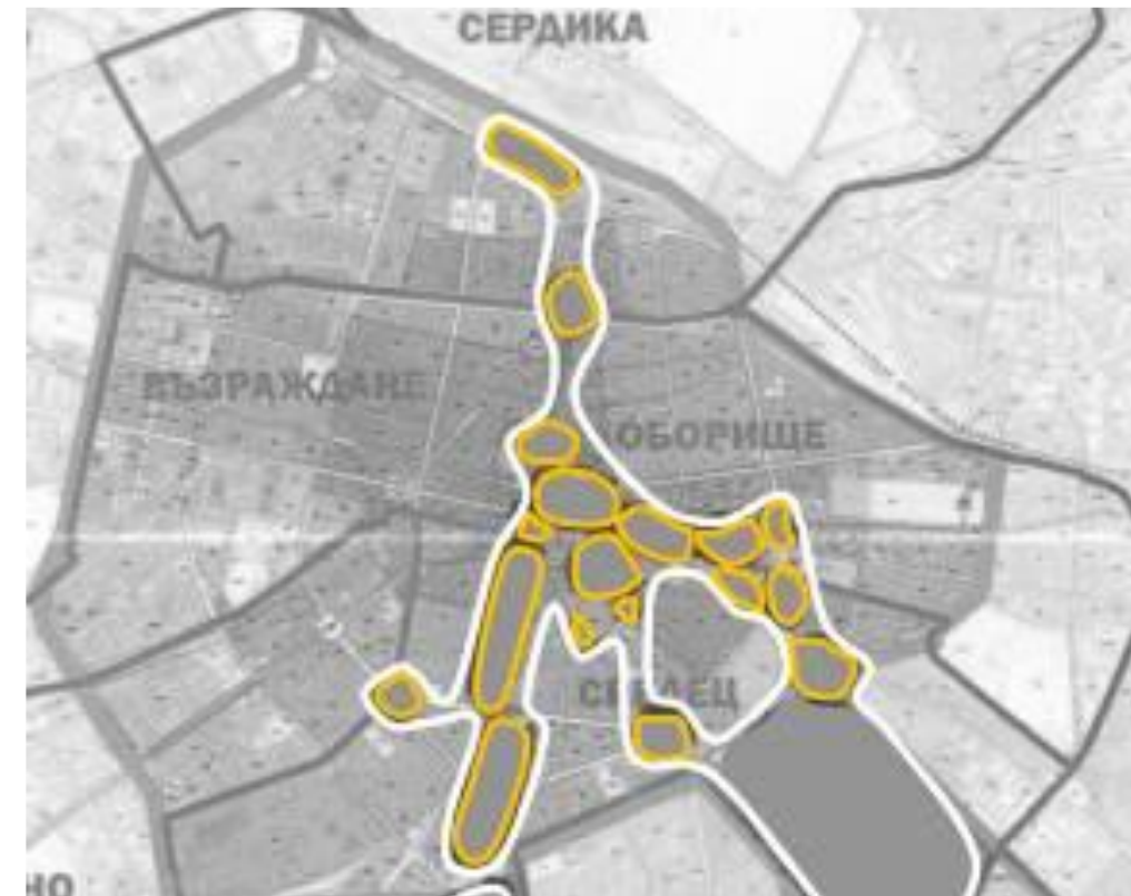
Фиг. 3. Емблематични места в центъра на София.

За пълноценното разкриване на потенциала на КН от съществено значение е налагането на устойчива политика за популяризирането му. Резултатите от същото проучване показват че по-голямата част от гражданите на София не познават културното наследство и не го оценяват адекватно. Освен това, за по-голяма част от гражданите, културното наследство е пречка за реализиране на различни инвестиционни инициативи, като културните ценности не се възприемат като възможност, а като затруднение. За преодоляването на тези проблеми е необходимо да се активизират и реализират различни форми на популяризиране и педагогика на наследството – дейност, която да обхване различните възрастови и целеви групи.